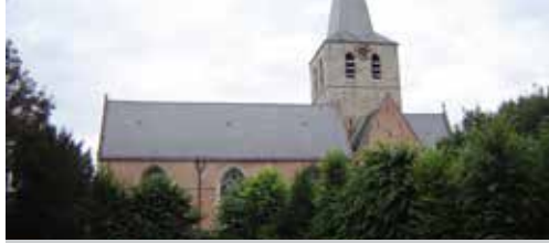
Onduidelijke toekomstvisie kerkgebouwen p.2