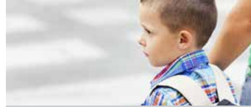
Schoolstraat Merendree goedgekeurd p. 3